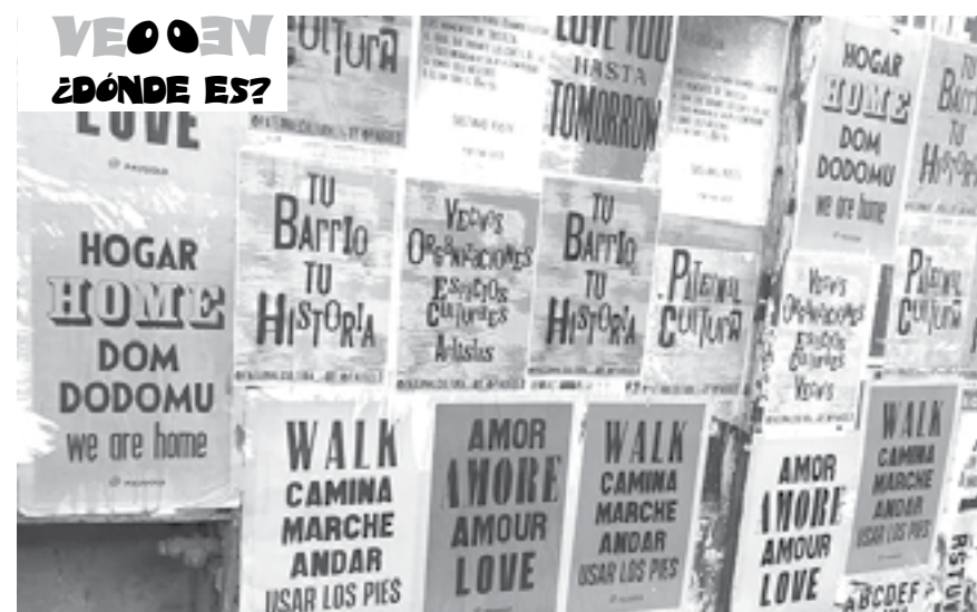
Si se creía un experto del barrio y conocía todos los rincones del mismo, le proponemos un juego para a través de imágenes. "MURAL: TU BARRIO TU HISTORIA" Paternal Cultura, artista Pau Gold. (Resp. pág. 16)