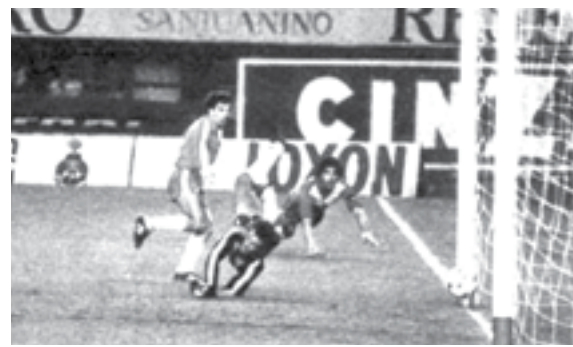
Argentinos Juniors 1985 Jorge Olguin, Adrian Domenech, Jose Pavoni, Enrique Vidalle, Carmelo Villaiba, Sergio Batista